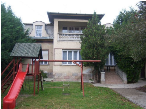
Szent I. h.u.