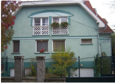
IV. u. A és B oldal